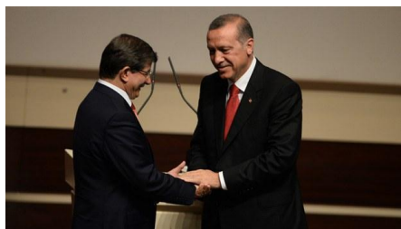
(ダーヴトオール外相(左)、エルドアン首相(右))