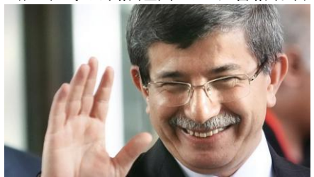
(ダーヴトオール外相)

ダーヴトオール外相の強力な支持者には、AKP のヤルチュン・アクドアン議員（首相顧問）率いる若い世代の政治家グループが含まれている。エルドアン首相がダーヴトオール外相を新たな首相に決定したことで、AKP 党員間の若い世代とシニア世代間の闘争が恐らく終わったことを示しているのだろう。